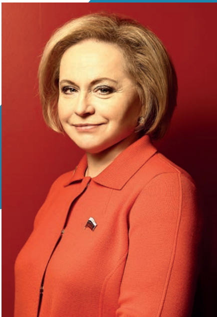
Любовь Николаевна Духанина, заместитель председателя Комитета по образованию и науке ГД РФ, член Центрального штаба ОНФ, координатор проекта «Равные возможности – детям»